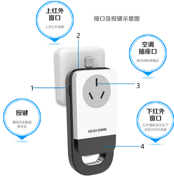
接口及按键示意图